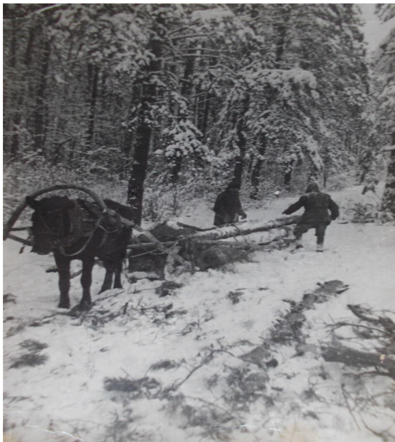
Заготовка леса для строительства нового дома.