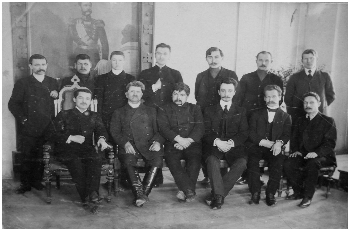
Члены Алексинской Уездной Земской Управы.