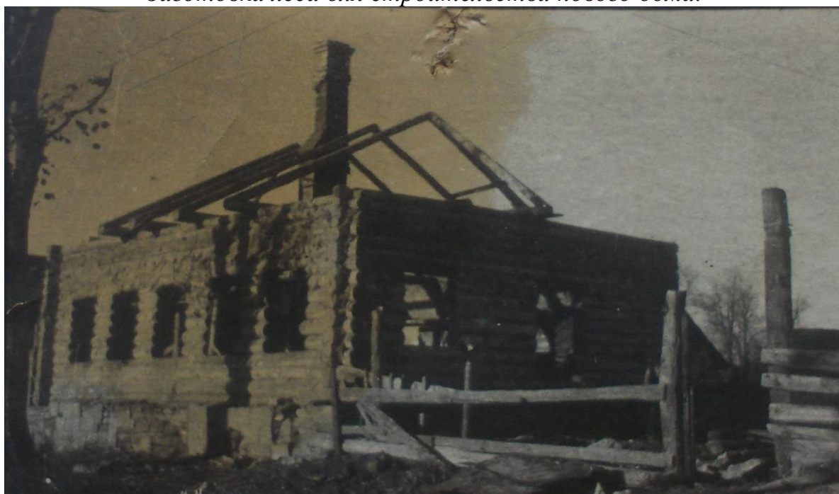
Восстановление дома после пожара во время ВОВ.