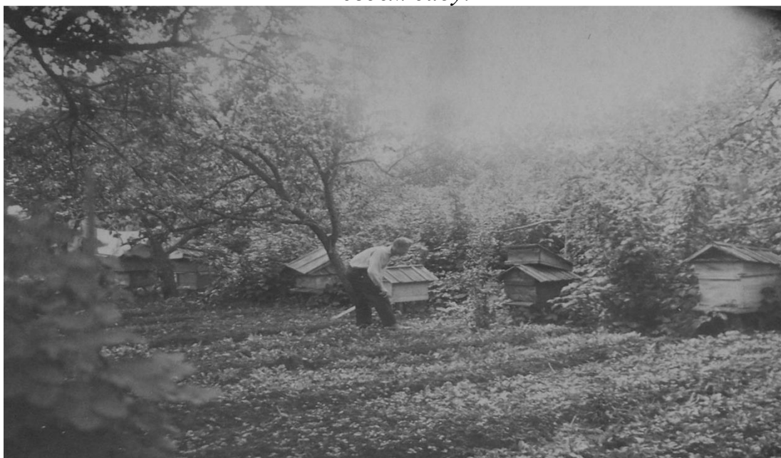
Разведение пчёл – любимое занятие прапрадедушки.