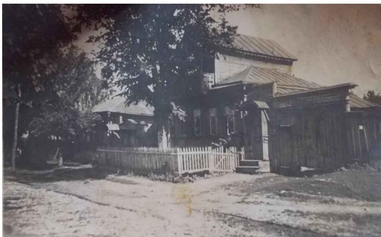
(конец 19 - начало 20 века)