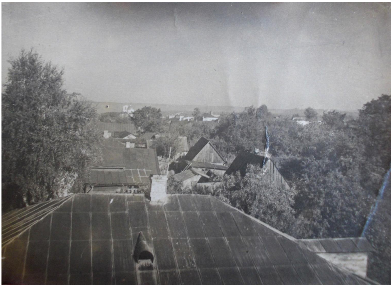
Вид со светёлки.