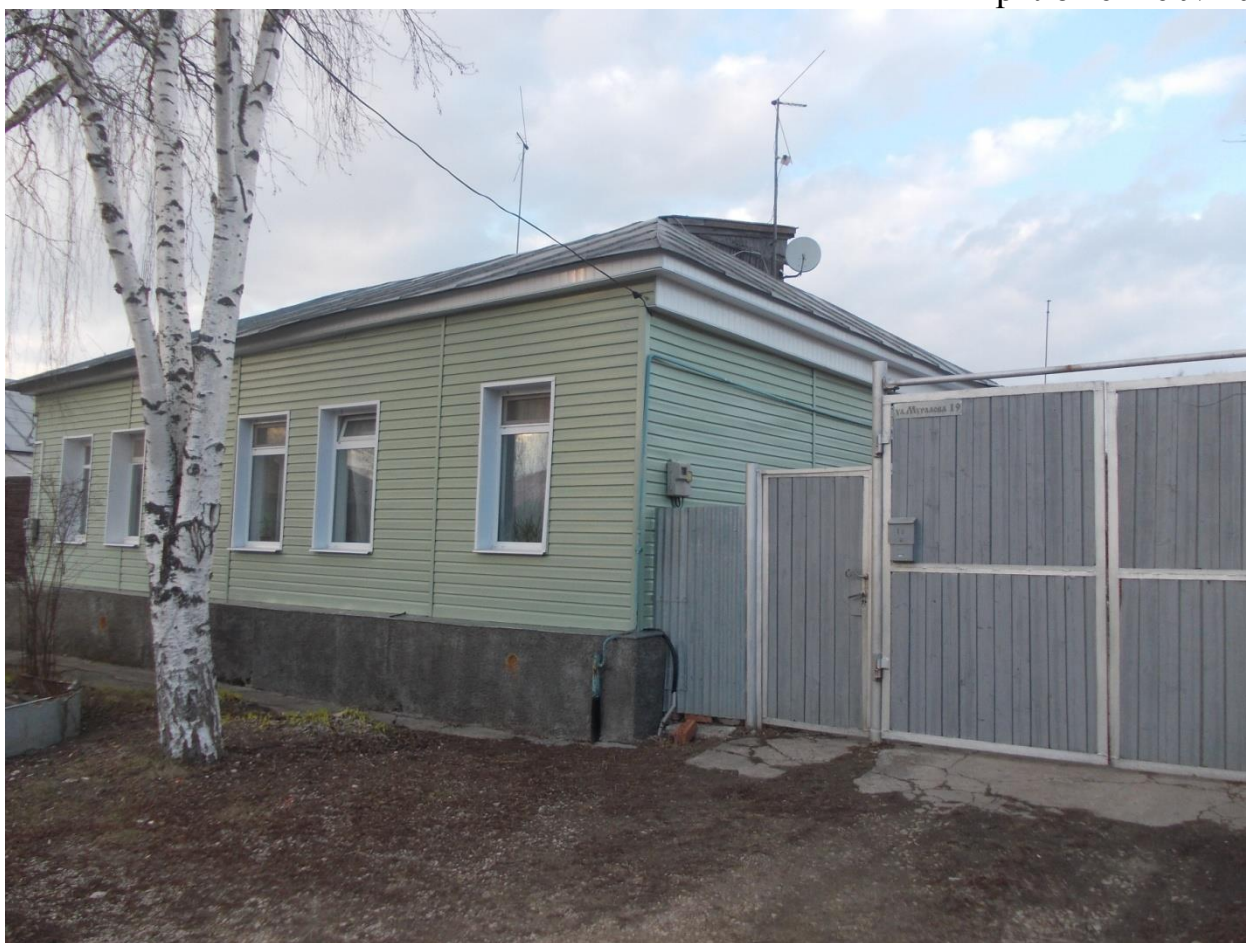
Так дом выглядит сейчас.