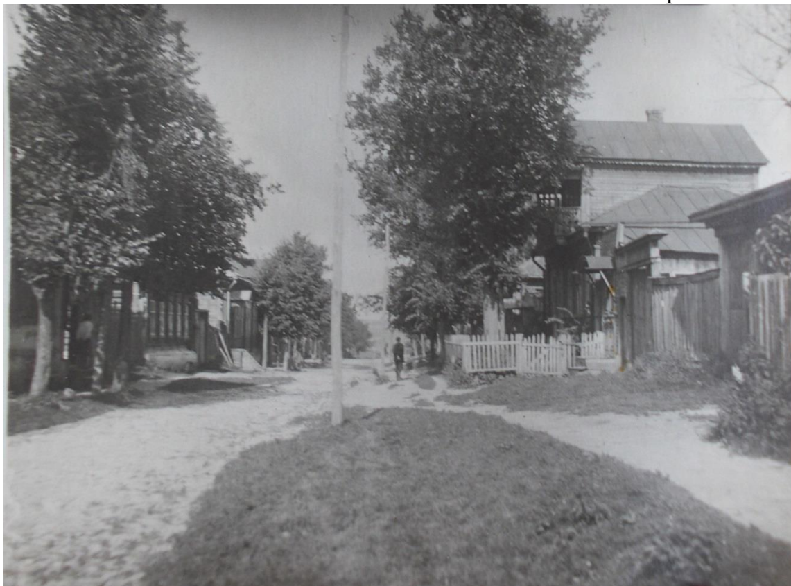
Улица Пушкинская, дом №19