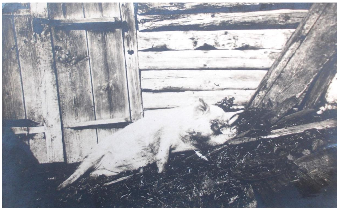
В большом хозяйстве семьи были и свиньи.